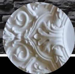
Лепнина любой сложности